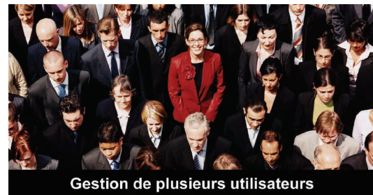
Gestion de plusieurs utilisateurs